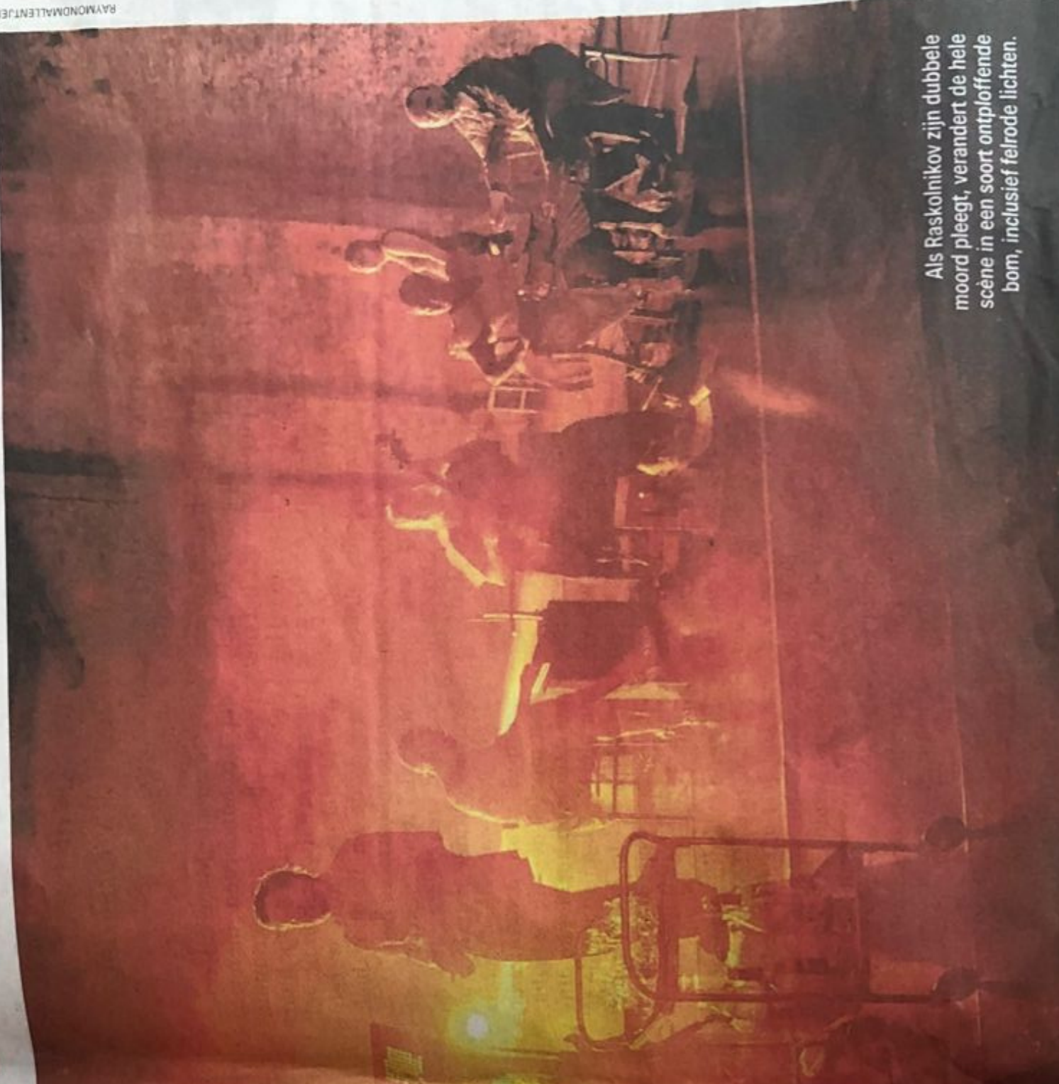
Als Raskolnikov zijn dubbele moord pleegt, verandert de hele scène in een soort ontplofende bom, inclusief felrode lichten.

setting met personages. Lazarus slaagt er bij momenten goed in om dat te doen.