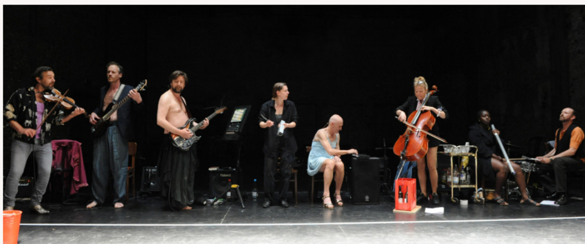
De acteurs spelen het circuslied aan het begin van het stuk.

Je hebt het waarschijnlijk al wel door: geen lichte thema's of koetjes en kalfjes. Net daarom is de voorstelling van ARSENAAL/LAZARUS zo geniaal. Als toeschouwer krijg je er namelijk geen zwaar of beklijvend gevoel van. In de eerste paar minuten van Misdaad en straf spelen de acteurs een lied dat mij aan circusacts doet denken. Je hebt nog geen idee wat er zal volgen, maar hiermee zetten ze – letterlijk – de toon. Niet dat ze een circusact brengen, maar het hoeft allemaal niet té serieus te zijn.