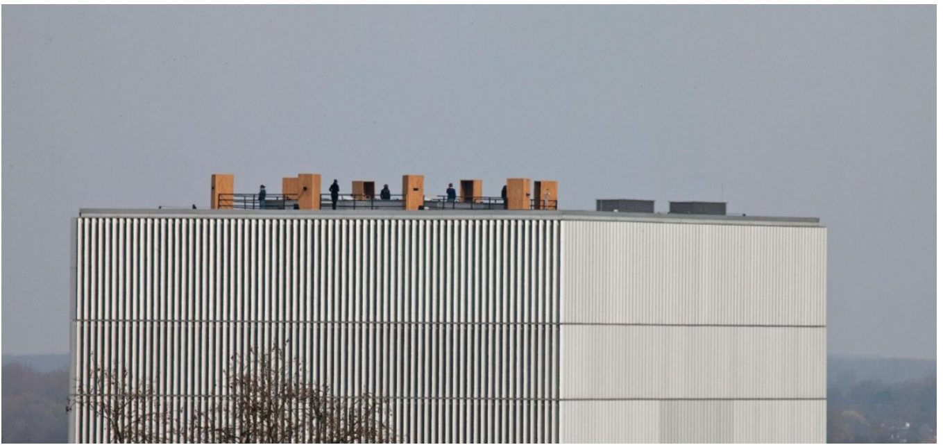
Saturn. Karl Van Welden